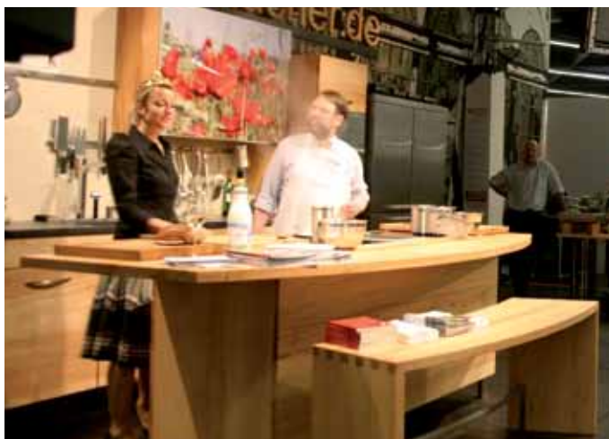
Kochshows mit Inhalt: Gesundheit, interessante Menschen und Lebensqualität. Shows am Fr. 16:30 Uhr, Sa. 12:30 Uhr und So. 13:00 Uhr